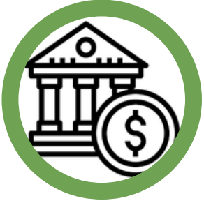
BANCA Y SEGUROS