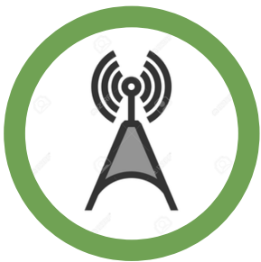
TECNOLOGÍA Y TELCOMUNICACIÓN